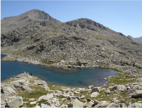
Imagen del litoral del lago, salida de agua hacia el Estany Xic del Pessó.