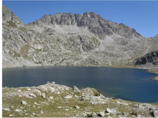
Imagen del lago desde el litoral.